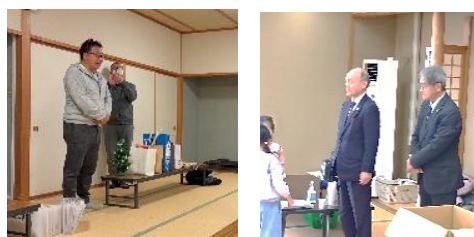
江釣子ライオンズクラブ様 和賀ライオンズクラブ様

他にも、子ども食堂にお菓子やジュース、野菜等を届けてくださった方や企業さんがあり、おやつにしたり、お家へのお土産として持たせたりしました。子ども達が多くの方に見守られていることを実感しました。