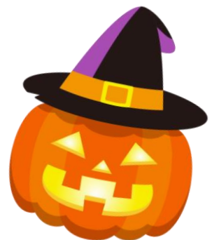
目鼻口の形のシールを貼って、可愛いかぼちゃに。